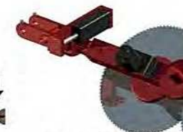
Giro hidráulico del módulo de corte (varía la incidencia del corte)