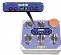
Indicador de RPM de motor