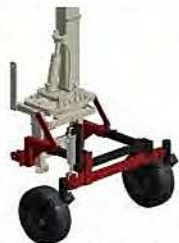
Chasis tripuntal con ruedas y estabilizador