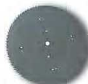
Disco de widia (para cítricos)